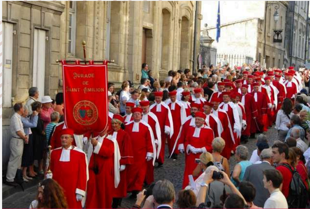
La Jurade de Saint Emilion