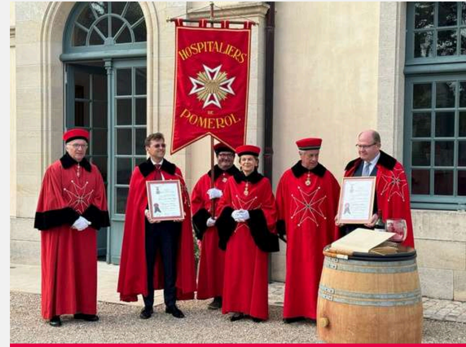
Les Hospitaliers de Pomerol