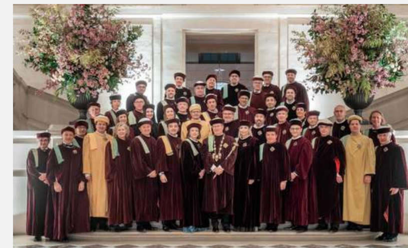
La Commanderie du Bontemps, Médoc, Graves, Sauternes & Barsac