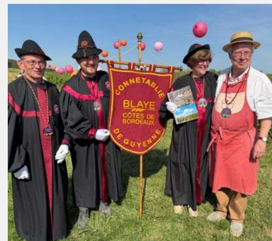
Connétablie de Guyenne Blaye Côtes de Bordeaux