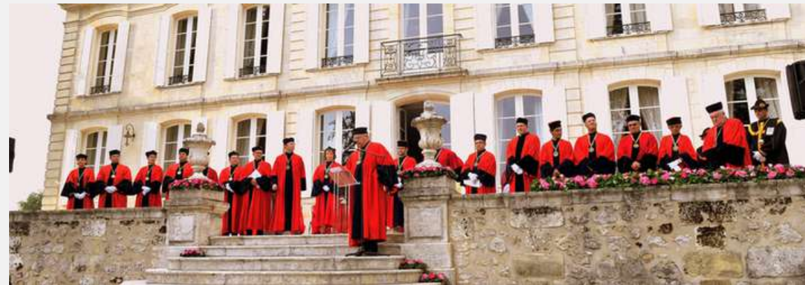
Les Gentilshommes du Duché de Fronsac