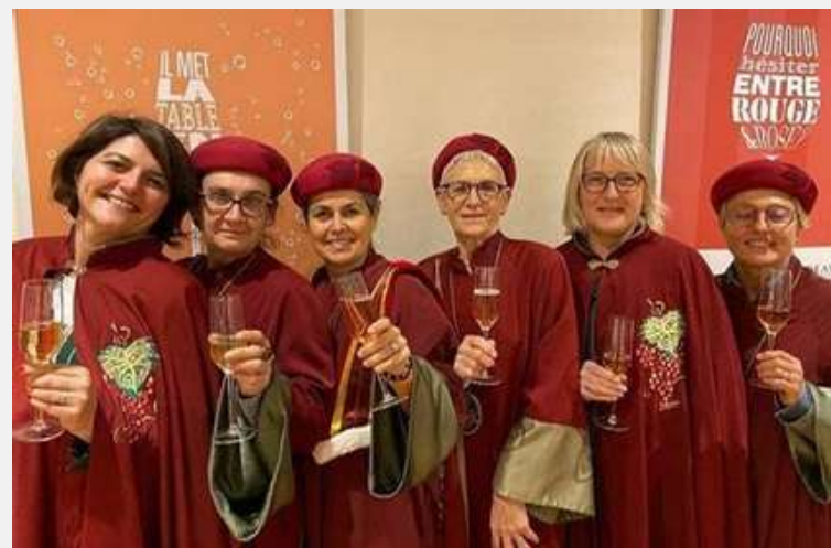
L'ordre des Vignerons des Bordeaux - Bordeaux supérieurs