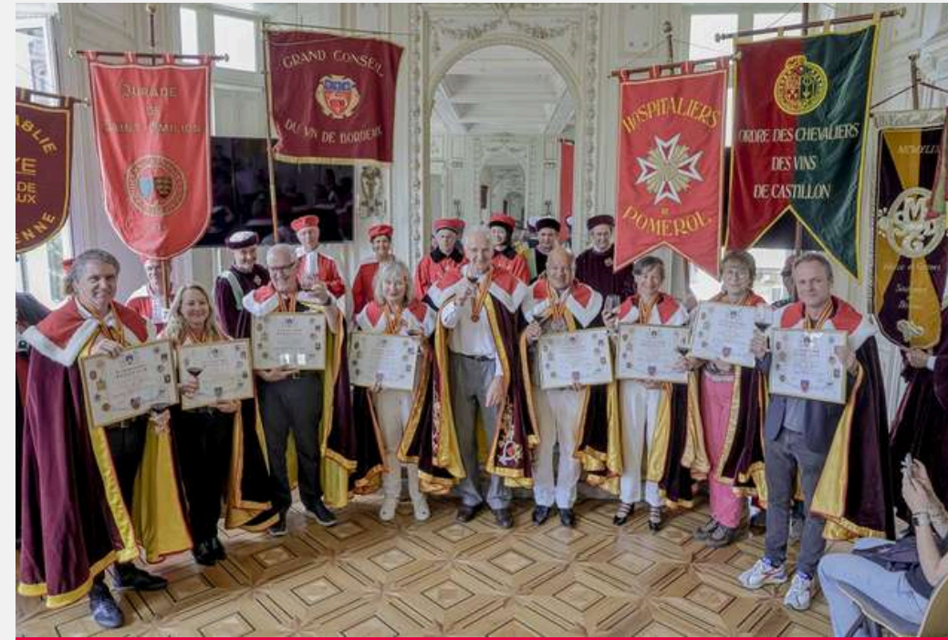
Bordeaux Fête le Vin 2024