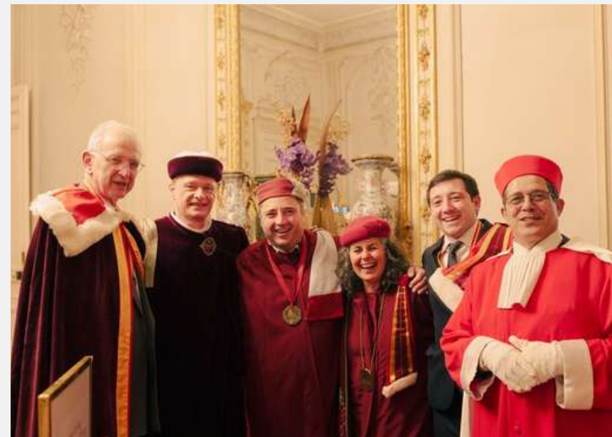
Soirée Vino-diplomatie au Sénat